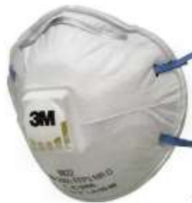
Foto 1. Esempio maschera con valvola