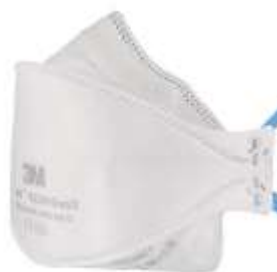
Foto 2. Esempio di maschera FFP2 senza valvola